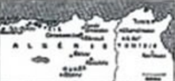
Les attentats ont été commis simultanément dans les régions de Constantine, d'Alger et d'Oran.