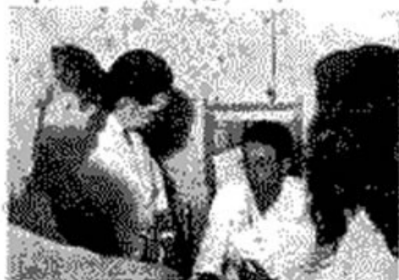
Des combattants algériens à Philippeville, le 24 juillet 1957.