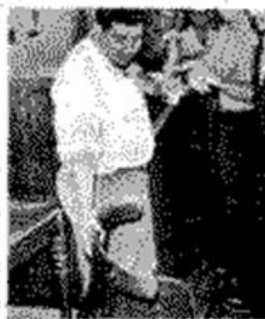
Un combattant algérien à Philippeville, le 24 juillet 1957.

COMMUNIQUE ALGER, 24 juillet 1957. — Le mouvement insurrectionnel déclenché samedi à midi à Philippeville, visant Constantine, Philippeville et de nombreux centres du Nord constantinois, a été réprimé avec la plus grande efficacité. Les forces de l'ordre, mises en état d'alerte, ont réagi avec rapidité et efficacité. 800 rebelles ont été tués, 475 cadavres de hors-la-loi ont été dénombrés, 800 prisonniers ont été faits. La zone est 100 % libérée après 48 heures de combats.