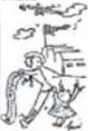
Les élections américaines ont été marquées par la participation de nombreux candidats, dont certains ont obtenu de bons résultats. Les élections ont été marquées par la participation de nombreux candidats, dont certains ont obtenu de bons résultats.