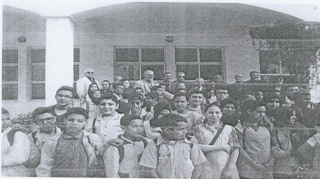
Les élèves de l'enseignement moyen participent à cette communication