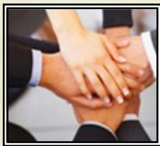
LA CONVENTION SIGNÉE ENTRE L'UDL ET L'INCUBATEUR DE SIDI BEL ABBES

Une convention cadre a été signée entre l'Université Djillali Liabes et l'Incubateur de Sidi Bel Abbès, le 14 novembre 2011 en présence de Monsieur le ministre de l'industrie, de la PME et de la promotion de l'investissement et de Monsieur le Wali de Sidi Bel Abbès.