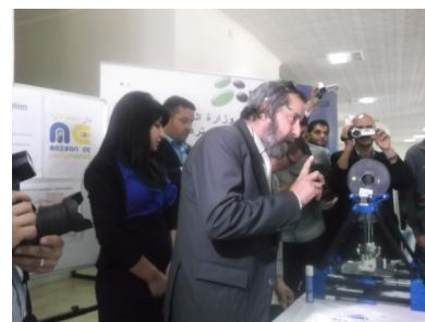
La première imprimante 3D mise à la disposition des étudiants-porteurs de projets au niveau national, acquise par l'Incubateur de Sidi Bel Abbès, a été présentée lors des festivités de la journée nationale de l'étudiant, le 19 Mai 2014.

Les entreprises doivent être rigoureusement sélectionnées. En plus d'un bail, les promoteurs sont régis par un règlement intérieur