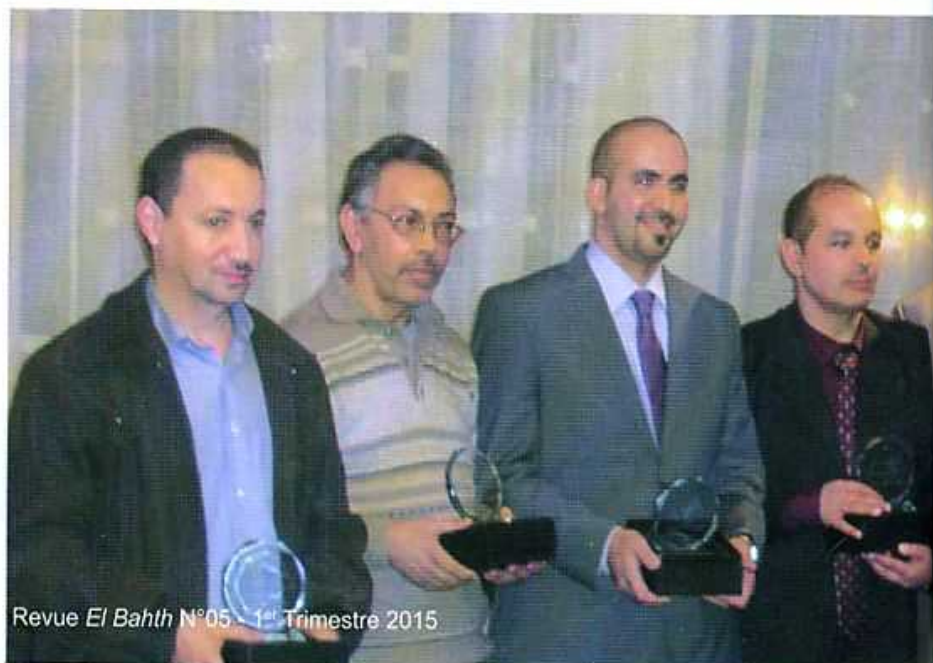
Revue El Bahth N°05 - 1 er Trimestre 2015